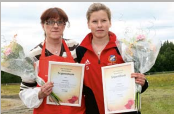
Vi förvaltar även Ivan Nordströms Minnesfond Stipendiet delas ut varje år under travet. BG 5637-8722

Idrottsföreningen som grundades 1932 har ca 500 medlemmar. Vi består av fem sektioner Hockey, skidor, fotboll, gymnastik och styrke.