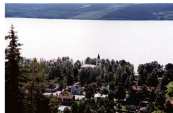
Täsjö kyrka där det i slutet på juni arrangeras Musik vid Täsjö Stränder med mångakonsert, och det är gratis att lyssna.

är ett måste under dagarna i området. Slöjdmässan i skolans matsal välbesökt varje år. Efter att ha smält upplevelsorna från rundan kring Täsjön kan man efter en natt på något av de många borden som finns i området göra utflykt till centralorten Strömsund efter E45 med Bepemuseet på Öhn, eller några av de festligheter som anordnas, eller sevärdheter som finns. Efter vägen kan man fiska i Bjurtjärn som har handikappramper. Vill man i stället åka "Bävervägen", sträcker sig från Norråker till Stavreviken norr om Sundvall. Väg 346 mot Backe, där festligheten Fjällsjömarknan går av stapeln 4-5 juli med bland annat Nordman på scenen. Torghandel och karnevalståg. Före Backe finns Rossön med golfbana, mindre flygfält, hembygdsgård, Stenmuseum, kyrka. mm. I Fjällsjöområdet finns mängder av hällmålningar och boplatser som visar att området varit befolkat för ca 7000 år sedan. Hembygdsgården i Backe, liksom den unika bifurkationen i Vängelälven vid Brattforsen är besöksmål, eller varför inte kyrkan. Från Backe kan man lätt ta sig vidare till Ramsele med SVAR (släktforsning) och mycket annat, eller till Junsele som har djurpark. Lämpliga dags, eller halvdagsturer utan att missa det som sker på travovalen. Hela området är en bygd att förläsa sig i, så tag chansen.