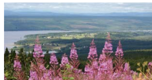
Täsjöberget, Ångermanlands tak med vacker utsikt och botaniskt spännande.