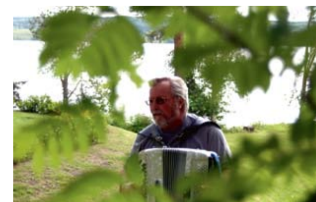
Musik vid Täsjö Stränder erbjuder stor variation i musikutbudet.