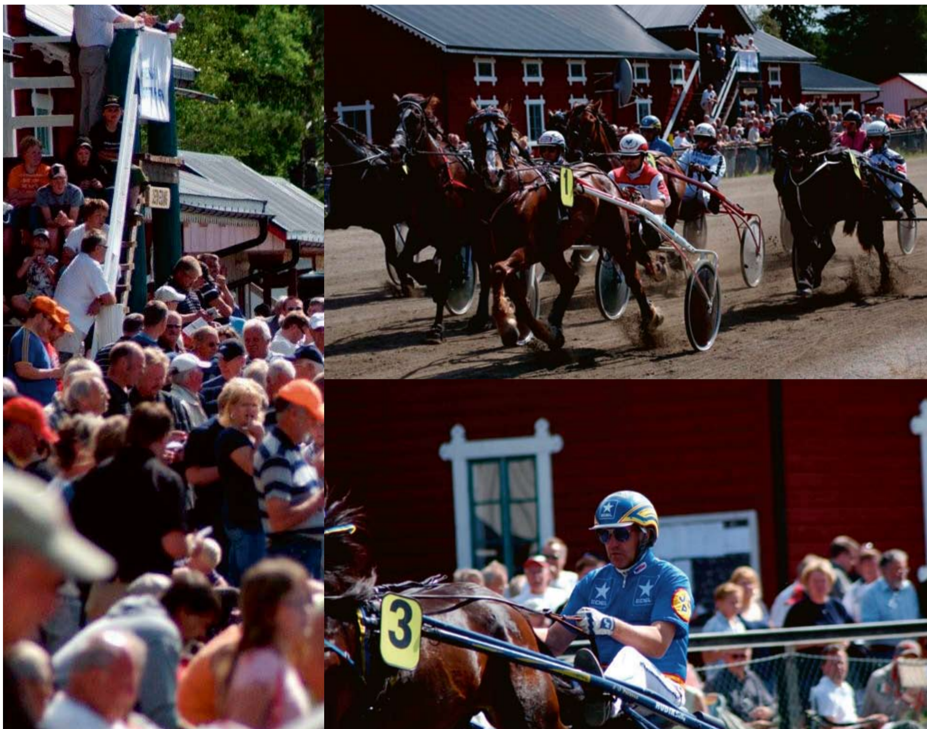
Texter: Bjarne Engholm Produktion: ÖstersundsTidningar Tryck: MittMediaPrint

Alla inblandade hoppas på en trevlig och värdmässigt bra åttadagarsvecka med mycket folk.