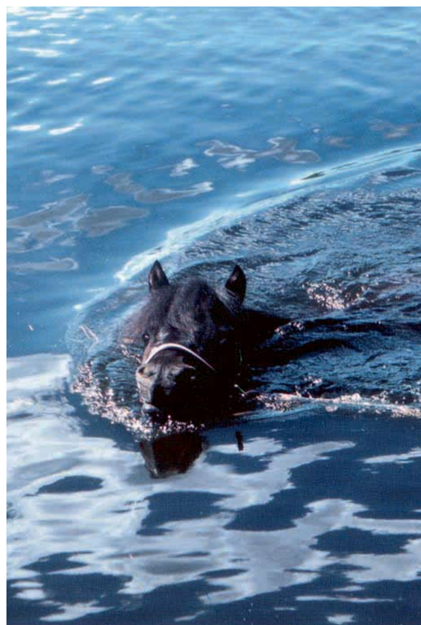
Även Järvsöfaks passade på att njuta av bad och simning, vid sitt besök 2007!