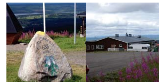
Täsjöberget, Ångermanlands tak med vacker utsikt och botaniskt spännande.