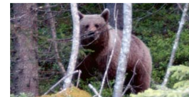
Har man tur kan man se björn under resan Täsjön runt.